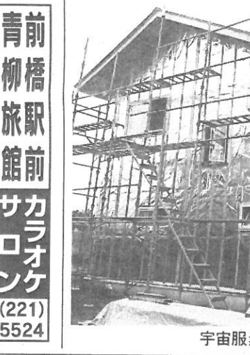
宇宙服素材で外壁を包む様子

「宇宙服ハウス」の開設承認された。同社は94年設立。95年に県内のオール電化住宅を建設。以来、高断熱高気密住宅を手掛けている。北関東住宅開発ネットワークに参加し研究を続けてきた。「宇宙服ハウス」の開